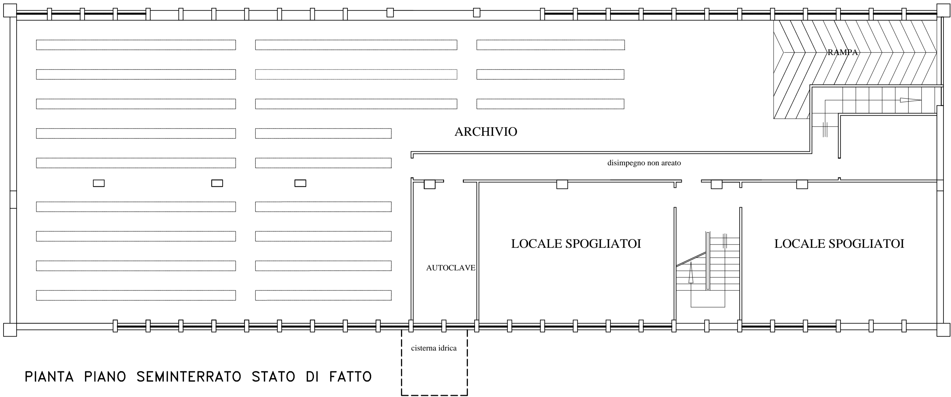
PIANTA PIANO SEMINTERRATO STATO DI FATTO